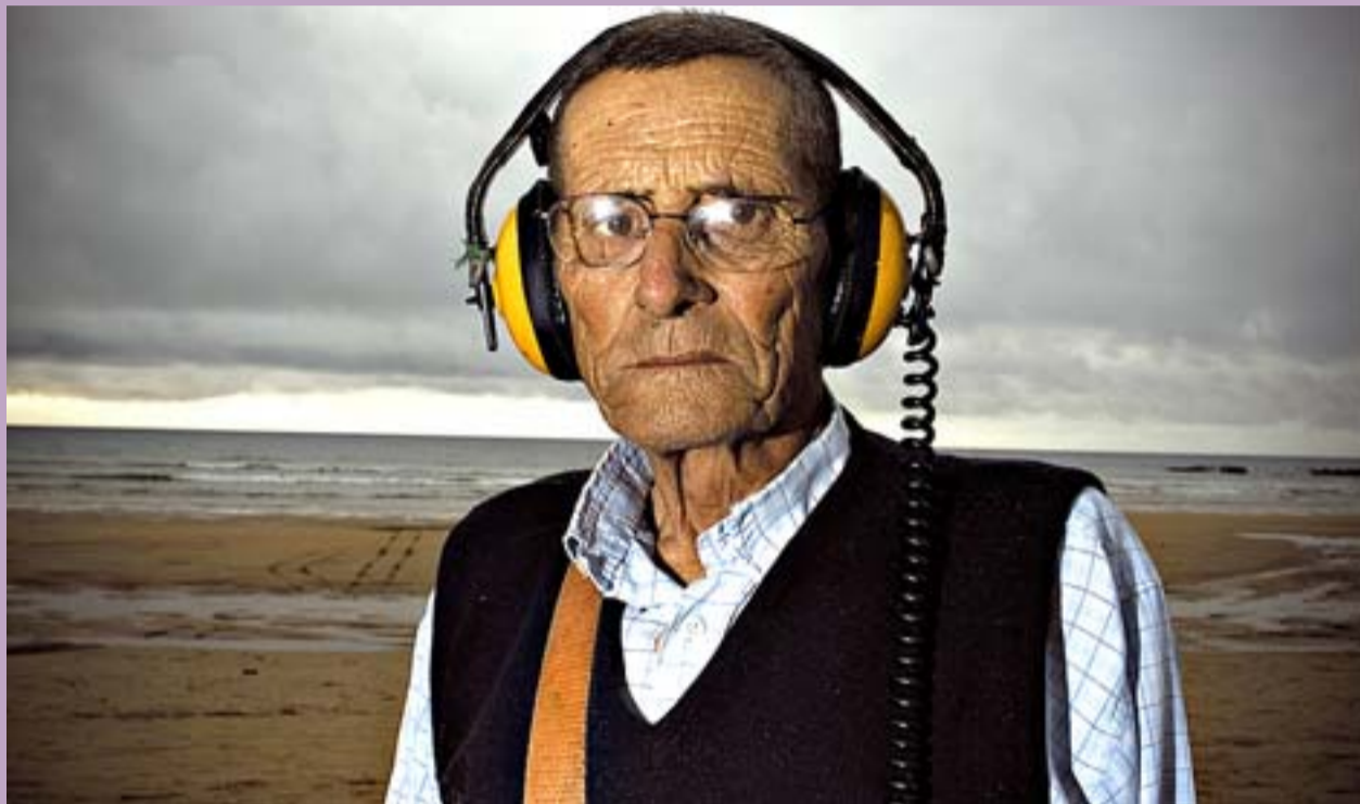
Gijón 3, de Jordi Farrés, és la foto guanyadora del 2007. Mostra una platja de Gijón (Astúries) a les set de la tarda. DIOMIRA

Per 8è any consecutiu arriba el Clic, en la seva edició de 2008, un concurs per a fotoreporters joves, de fins a 30 anys, que cada vegada té més prestigi.